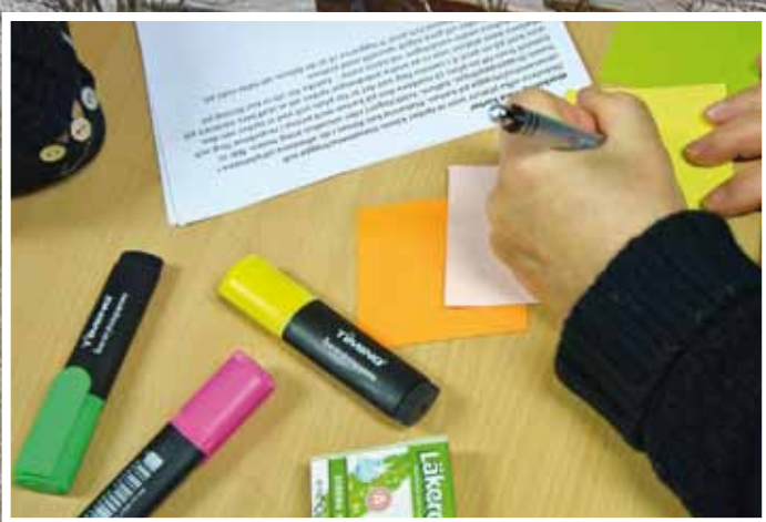
Hyresgästerna hade färgglada pennor och lappar till sitt förfogande när de skulle framföra sina åsikter inför renoveringen av Orren.